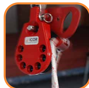
Poulie de relâche du mousqueton tournant

Les deux trousse sont équipées des outils essentiels de maniabilité à semi-distance des appareils suspects, y compris crochets, pinces, poulies - pour attacher et rediriger les articles- lignes en Kevlar® - codées par couleurs, à haute résistance avec faible coefficient d'allongement - une multitude de cales, pitons, mousquetons, câbles et cordes, pour agir en ancre.