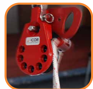
Swivel Release Pulley